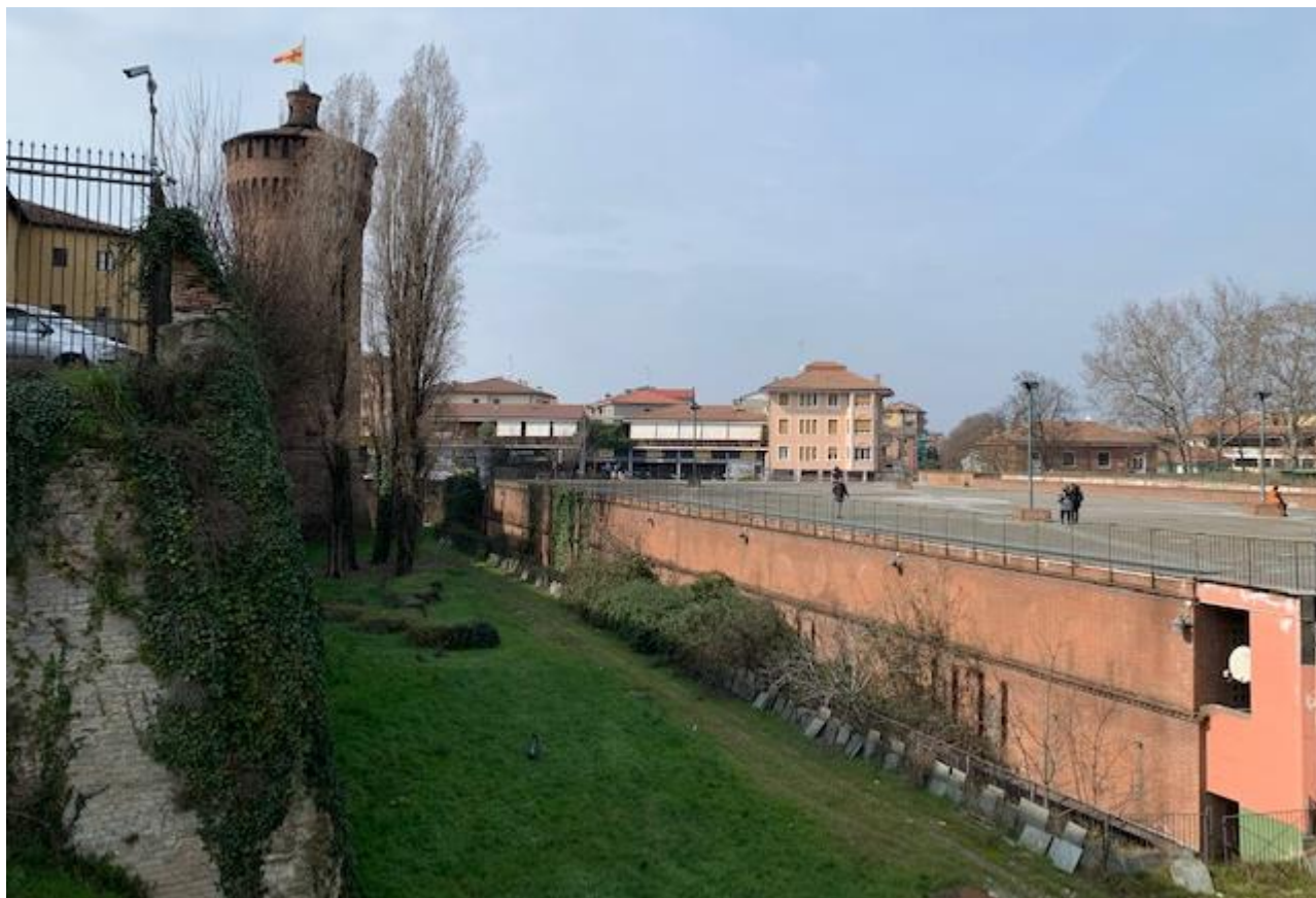
Fotografia 7. Fossato del Castello e parete laterale della Piazza Matteotti.