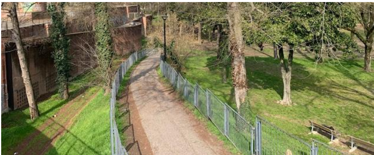
Fotografia 5. Passerella di discesa verso Parco dell'Isola Carolina.