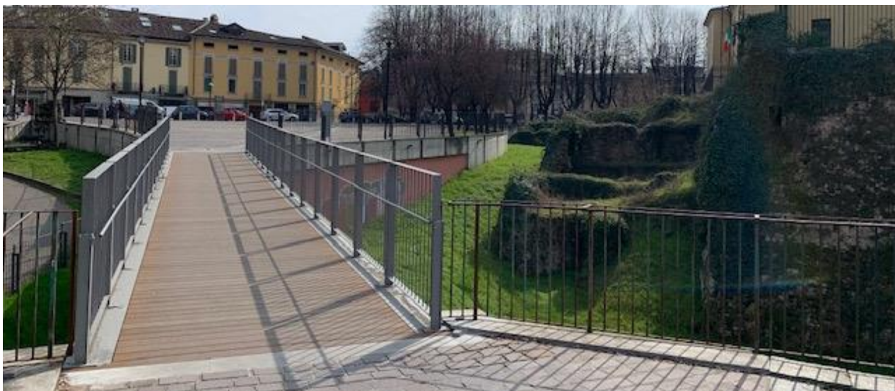
Fotografia 3. Passerella di collegamento da Piazza Castello a Piazza Matteotti.