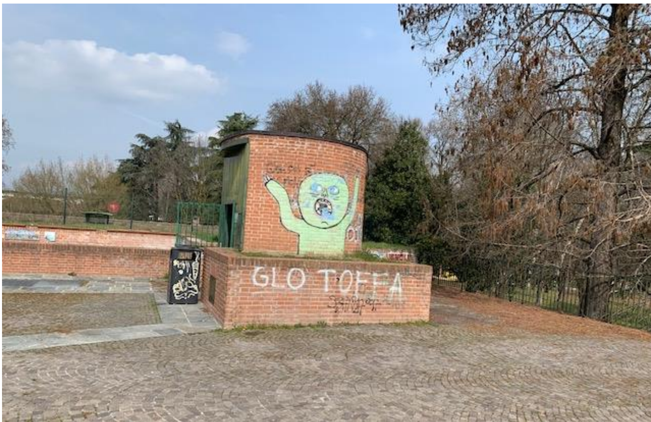
Fotografia 11. Piazza Matteotti – dettaglio vano tecnico ascensore per discesa a piani adibiti a parcheggio.