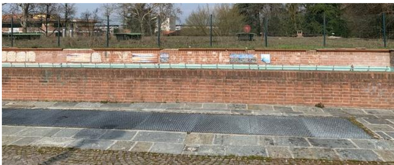
Fotografia 10. Piazza Matteotti – dettaglio muratura contenimento vasca decorativa.