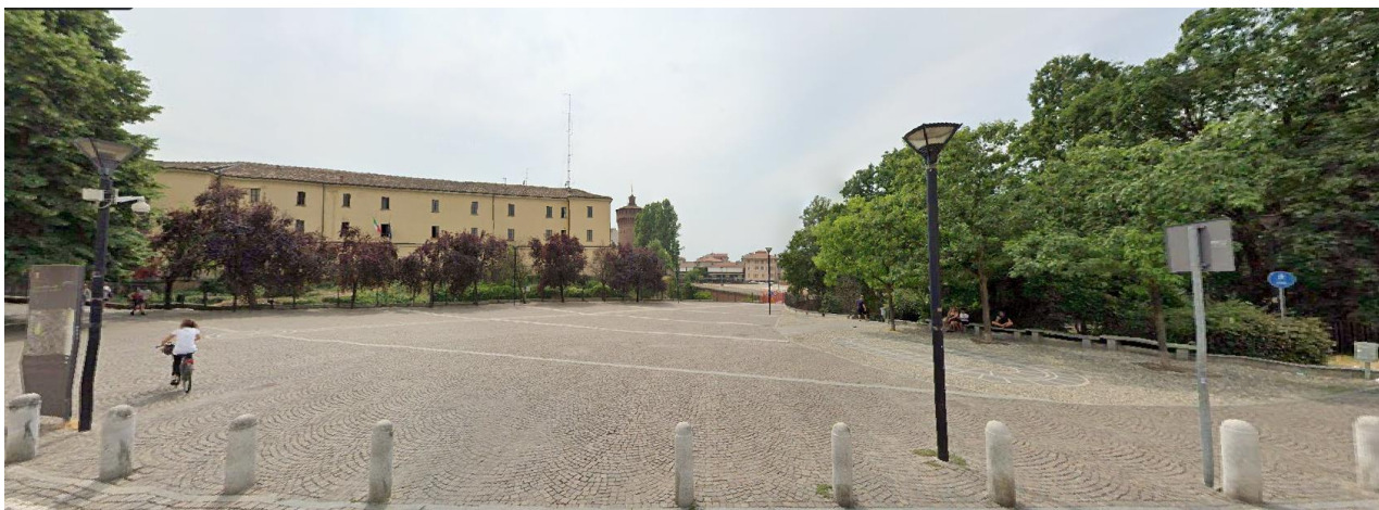
Fotografia 1. Piazza Castello, sullo sfondo Piazza Matteotti.