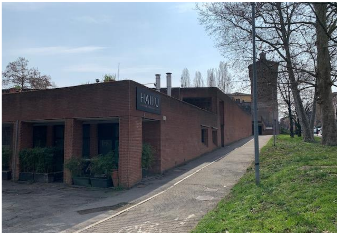
Fotografia 15. Vista dalla ciclabile di Viale Dalmazia del fronte laterale dell'edificio Piazza Matteotti.