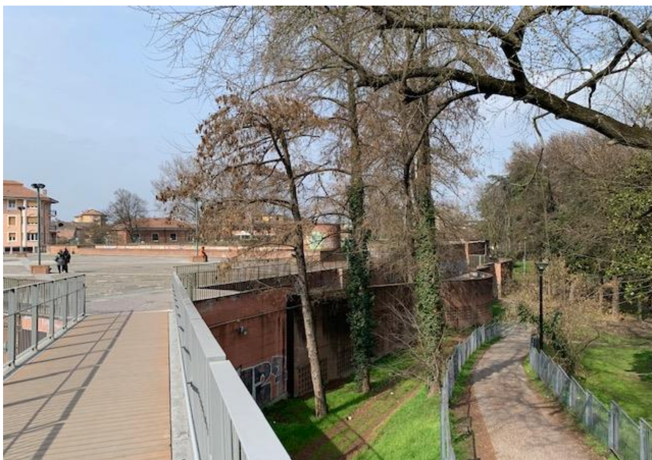
Fotografia 4. Passerella di collegamento e discesa verso Parco dell'Isola Carolina.