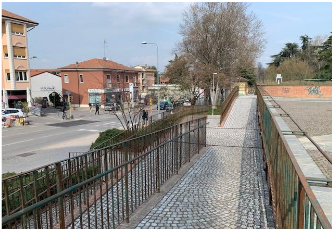
Fotografia 13. Piazza Matteotti – dettaglio vano tecnico ascensore per discesa a piani adibiti a parcheggio.