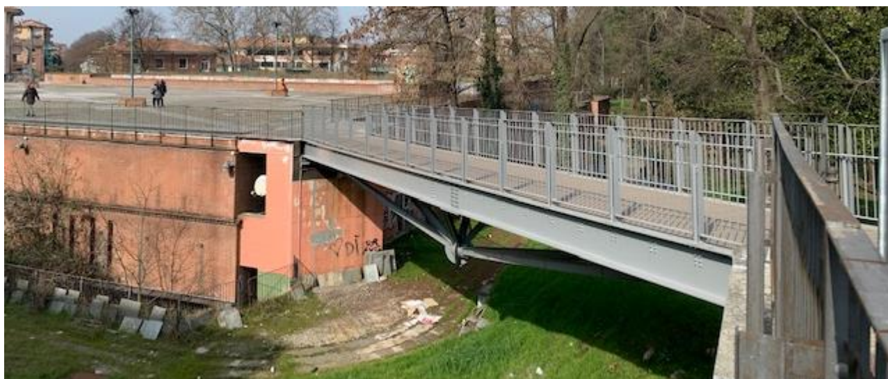
Fotografia 8. Dettaglio passerella e parete laterale della Piazza Matteotti.