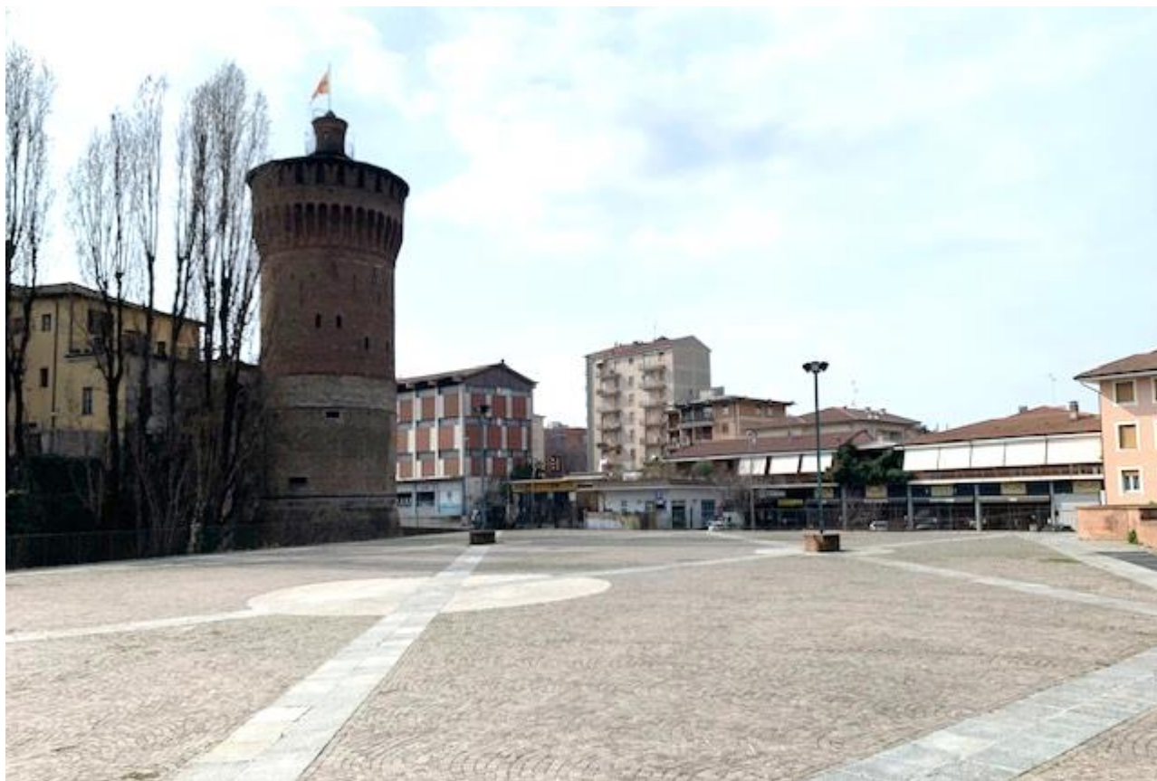
Fotografia 9. Piazza Matteotti e vista del Torrione.