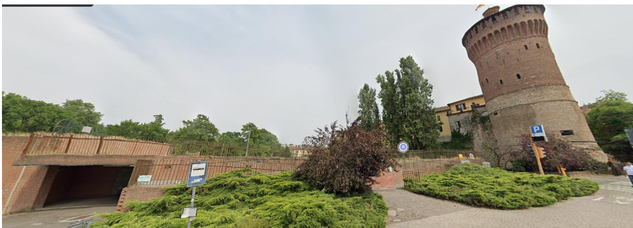
Fotografia 14. Vista di insieme delle rampe di accesso alla Piazza Matteotti e del Torrione.