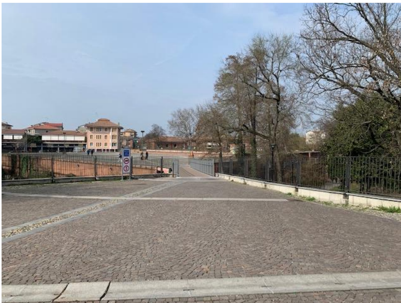
Fotografia 2. Piazza Castello, sullo sfondo Piazza Matteotti.