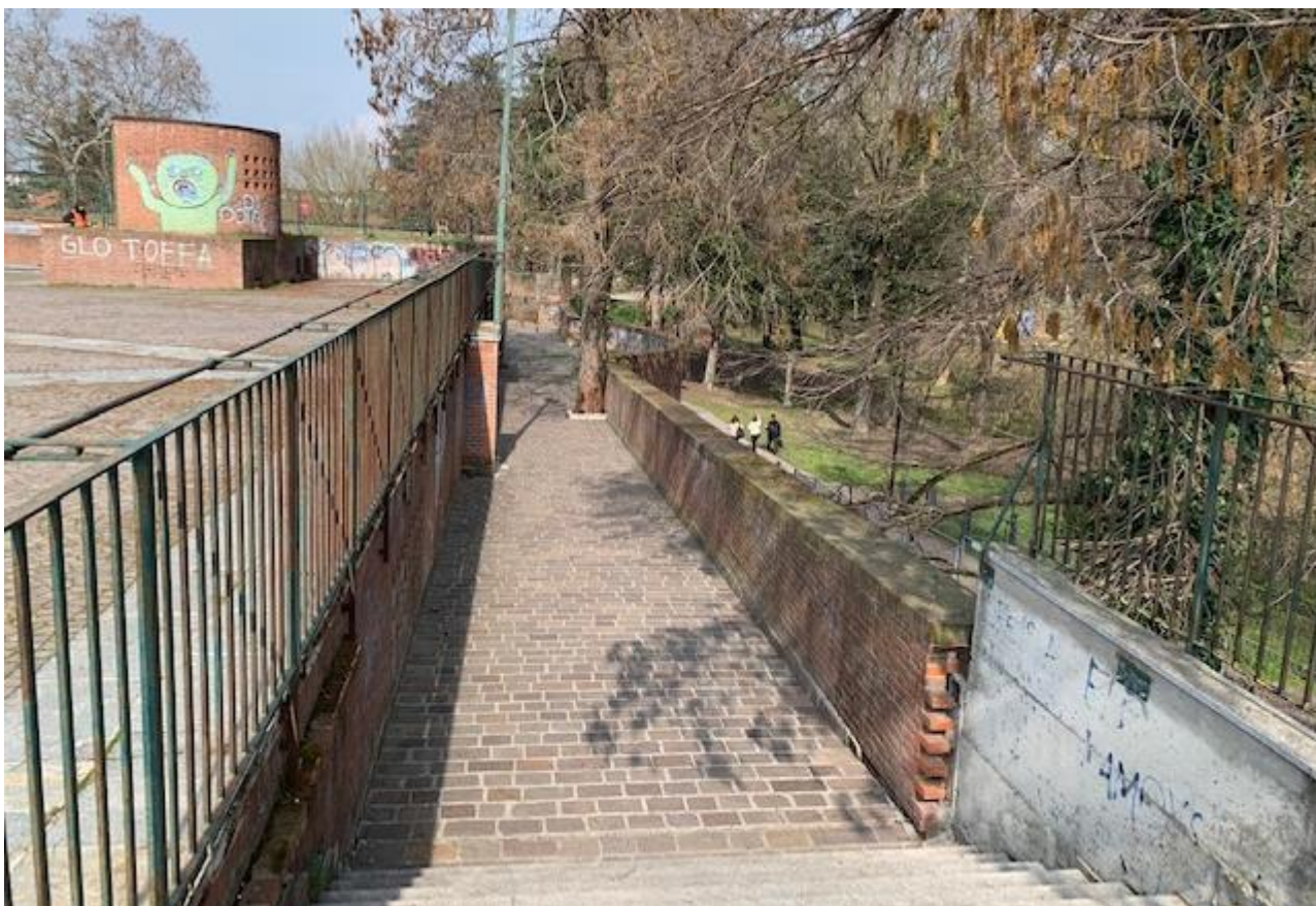
Fotografia 6. Passerella di discesa al livello sottostante della Piazza Matteotti.